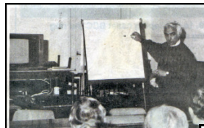
Foto- en Videoclub 'Loenen' Eerste video-avond succesvol verlopen