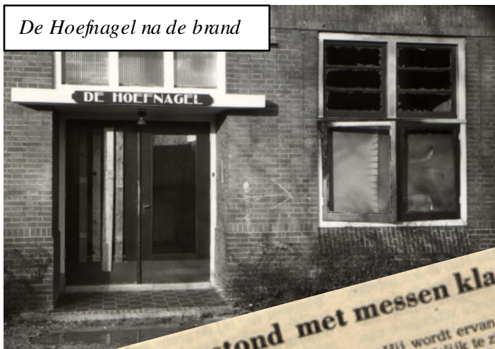
De Hoefnagel na de brand

En zo zitten we alweer op de helft van ons 50-jarig bestaan.