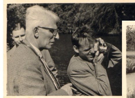
Eerste clubtocht 1958