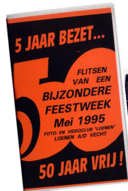
1995: Eerste grote videoproductie: Feestweek 50 jaar bevrijding

Langzamerhand groeit dit uit en er is nu bijna geen gebeurtenis in Loenen en de regio meer die NIET wordt gefilmd: optredens in 't Kampje, opening nieuwe gemeentehuis, intocht Sinterklaas, feesten op scholen, kooroptredens, toneelvoorstelling, Sight Sailing de Vecht, opening brandweerkazerne, eerste paal nieuwe Dorpshuis, enz. enz.