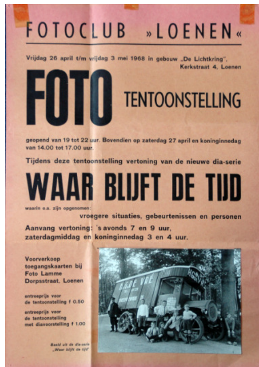
Tentoonstellingen in de jaren '60

In Korreligheden van december 1967 is te lezen dat het tij weer kan keren: voor de tentoonstelling van 1967 waren weinig foto's ingeleverd en er kwamen ook veel minder bezoekers dan in voorgaande jaren. De heer Joop Lamme klaagt er in het clubblad over dat er de laatste clubavond slechts 13 leden aanwezig waren, terwijl enkele jaren daarvoor nog een ledenstop nodig was: "De fotoclub krijgt concurrentie van Mies, Willem en Bonanza."