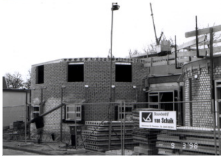
De bouw van 't Web is op foto en video vastgelegd

Het jaar 1998 is in meer opzichten een belangrijk jaar. Op 14 november wordt het "nieuw dorps huis" geopend (nu beter bekend als Cultureel Centrum 't Web), waar vanaf dan het vaste onderkomen van de club is. De ruimte is multifunctioneel, overdag in gebruik bij de Peuterspeelzaal en 's avonds voor verenigingen en cursussen. Het bestuur besluit geen doka meer in te richten, dit gezien de teruglopende belangstelling en de verwachting dat fotografie steeds meer de digitale kant op zal verschuiven. Achteraf gezien een zeer terechte beslissing. In plaats daarvan timmeren Johan de Veer en Evert Greefkes een grote verrijdbare kast, die op clubavonden uit de berging wordt gereden. Na het openen van de klep is alle beno-