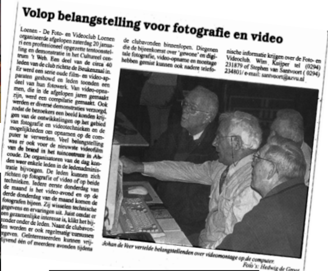
VAR - Verslag Open dag 2001

Verder zijn er nog af en toe fototentoonstellingen. Wim Kuijper exposeert met enige regelmaat in 't Kampje en de bibliotheek. In 2004 wordt een grote clubexpositie gehouden met als thema "Winter" in de bibliotheken in Breukelen en Abcoude.