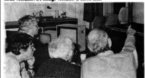
Monteren van videofilms op een werkavond.