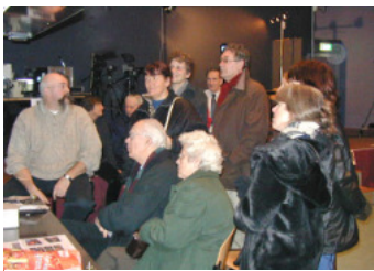
Demo Photoshop door Carel de Groot